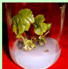
組織培養による増殖

研究室では、山形県や東北地方の在来植物を利活用するために、その特性の調査や分類・保存も行なっています。