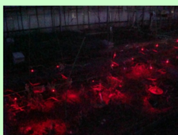
LED光照射による 花きの開花調節